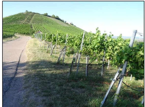
Abb. 6: Grassaum entlang des Wirtschaftswegs