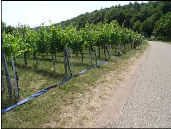
Abb. 3: Rebflächen, angrenzender Wirtschaftsweg

Das Untersuchungsgebiet besteht aus Rebflächen mit aus Süßgräsern und nitrophilen Krautigen bestandem Unterwuchs (Abb. 3-5). Aufgrund des regelmäßigen Einsatzes von Pestiziden und der regelmäßigen Befahrung mit Maschinen handelt es sich um artenarmes Grünland innerhalb der Rebparzellen. Zum Wirtschaftsweg liegt ein grasiger Saum, dessen Boden durch Tritt und Befahrung stark verdichtet ist (Abb. 6). Abgesehen von den Rebstöcken und artenarmen Wiesen ist das Untersuchungsgebiet gänzlich frei von Gehölzen und sonstigen Biotopstrukturen.