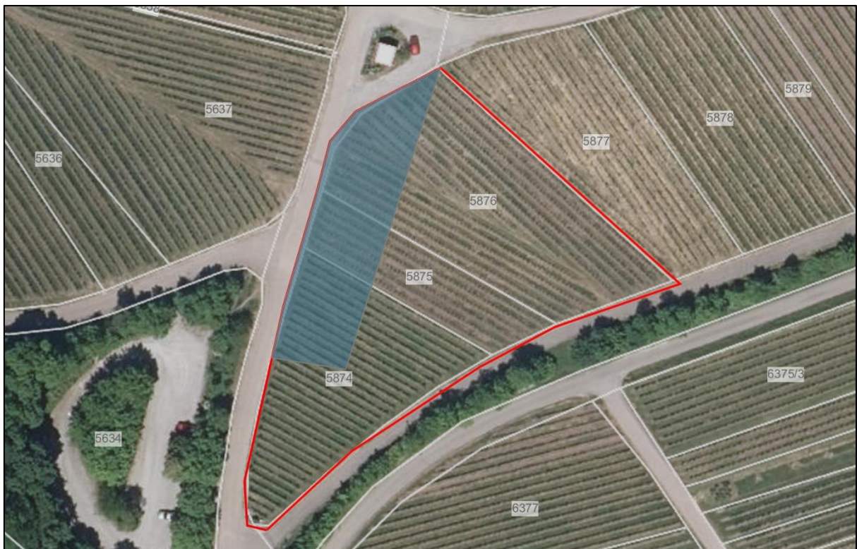
Abb. 1: Untersuchungsgebiet (rote Markierung), schematische Lage des Geltungsbereichs des Bebauungsplans (graue Markierung), ohne Maßstab; Kartengrundlage: Räumliches Informations- und Planungssystem (RIPS) der LUBW; Amtliche Geobasisdaten © LGL, www.lgl-bw.de , Az.: 2851.9-1/19 und © BKG ( www.bkg.bund.de )

Die Weingärtner Cleebronn-Güglingen eG plant die Errichtung eines neuen Weinausschanks an der südwestlichen Flanke des Michaelisbergs, ca. einen Kilometer südlich von Cleebronn gelegen. Der ursprüngliche Weinausschank entspricht nicht mehr den Anforderungen und dem Bedarf an einen modernen Weinausschank, sodass auf einer Teilfläche der Flst.-Nr. 5874, 5875, 5876 der Gemarkungs-Nr. 885 (Cleebronn) ein geeigneter Alternativstandort für die Herstellung eines neuen Weinausschanks gefunden wurde. Hierzu wurde ein vorhabenbezogener Bebauungsplan „Weinausschank Michaelsberg“ aufgestellt. Das Gebäude des Weinausschanks ist mit einer Grundfläche von 360 m 2 (einstöckiges Gebäude mit 270 m 2 und 90 m 2 Außenterrasse) und einer Sitzplatzanzahl für bis zu 170 Personen geplant. Zur Beurteilung artenschutzrechtlicher Belange wurde bereits ein avifaunistisches Gutachten und eine spezielle artenschutzrechtliche Prüfung erstellt 1 . Aus den bisherigen Untersuchungen (Vögel und Reptilien) und Rücksprachen mit der Unteren Naturschutzbehörde (UNB) des Landratsamt Heilbronn hat sich herausgestellt, dass ein potenzielles Vorkommen von Reptilien und der Blauflügeligen Ödlandschrecke ( Oedipoda caerulea ) genauer untersucht werden soll, um mögliche artenschutzrechtliche Konflikte mit dem Bundesnaturschutzgesetz (BNatSchG) beurteilen zu können. Hierzu wurde das Büro roosplan beauftragt. Die im Jahr 2022 durchgeführten Kartierungen und deren Ergebnisse werden in dem vorliegenden Bericht dargestellt.