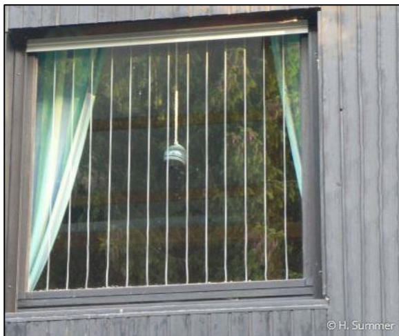
Abb. 7: Fenster mit dezenten vertikalen Linien