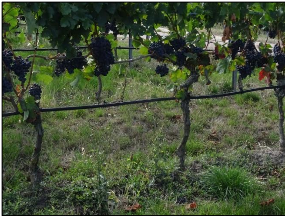
Abb. 5: Bewuchs unter den Rebstöcken