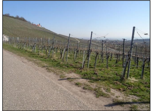
Abb. 4: Rebflächen im Winter